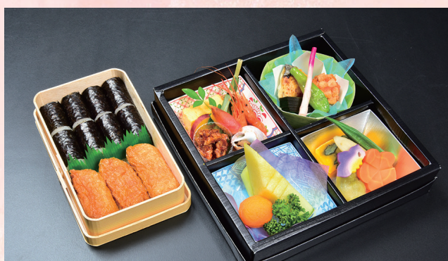
3 新盆会席弁当 4,104円 (税抜価格 3,800円)