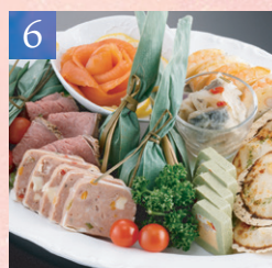
6 和洋オードブル盛合せ