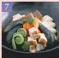
7 匠味豚と季節の煮物