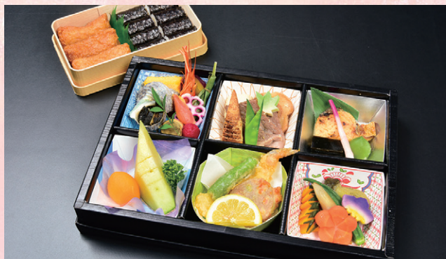
1 厳選和食弁当 5,184円 (税抜価格 4,800円)