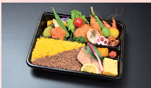
4 名菜彩り弁当 2,484円 (税抜価格 2,300円)