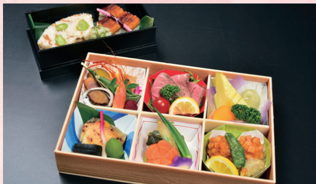
2 新盆特選弁当 6,264円 (税抜価格 5,800円)